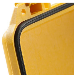
1753 Joint torique de remplacement