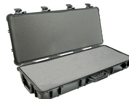
1700WF With Foam