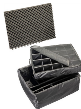
1695 Cloison en mousse