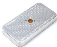
1500D Gel de silice dessicant