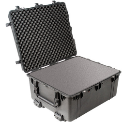
1690WF With Foam