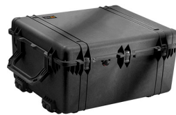
1690NF No Foam