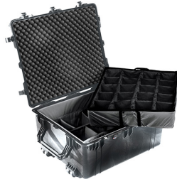
1694 With Padded Dividers