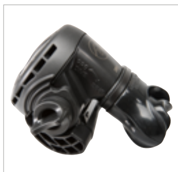
Calypso / Titan